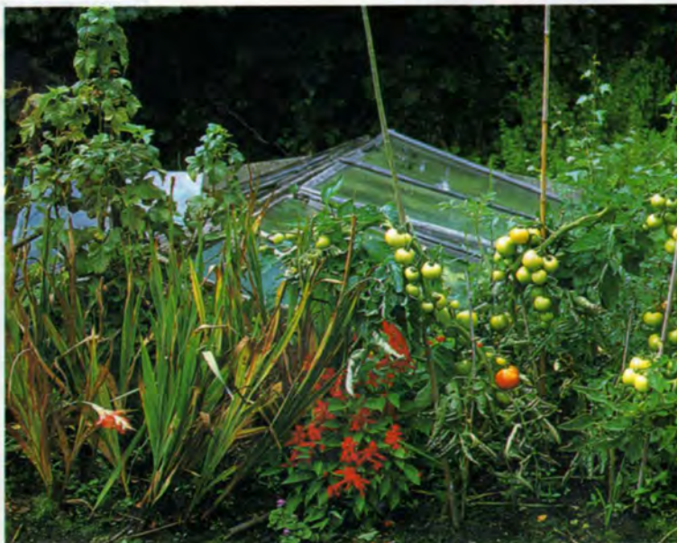
Groenten en bloemen staan hier gebroederlijk naast elkaar.

Zo is er bijvoorbeeld een stuk dat bewust niet beplant wordt. Vol spanning wacht men af wat daar zal opkomen. Spannend is ook de vijver, die heel wat kikkers, padden en salamanders aantrekt. Het is een natuurvijver van flink formaat die zoveel mogelijk met rust wordt gelaten. Hoewel er geen verplichting is, tuinieren de meeste mensen hier