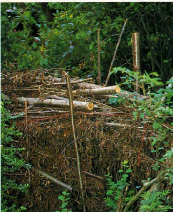
Een takkenwal als afscheiding trekt veel 'wilde dieren' aan.

Op Eigen Hof heeft zo elke tuinier zijn eigen voorkeur. Hoewel van elke tuin de eerste 75 cm met bloemen beplant moet zijn; op de rest van het perceel mag de tuinier zijn eigen hobby en creativiteit botvieren. Zo zie je tuinen met veel bloemen of een gazon, maar ook plekjes waar groenten en kruiden prominent aanwezig zijn. De meeste tuinen liggen er zeer goed verzorgd bij. Wie hier een tuin heeft, besteedt daar meestal veel tijd aan. ■